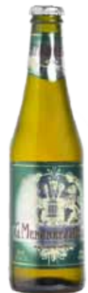
MENABREA STRONG 0,33 0,70