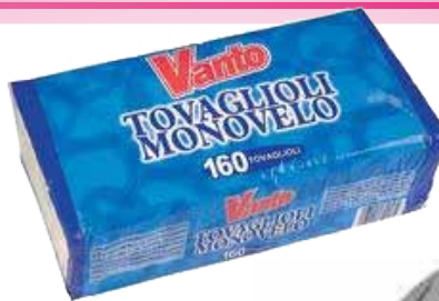
TOVAGLIOLI 1 VELO VANTO PZ. 160