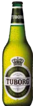
TUBORG BOTT. 0,66 1,05