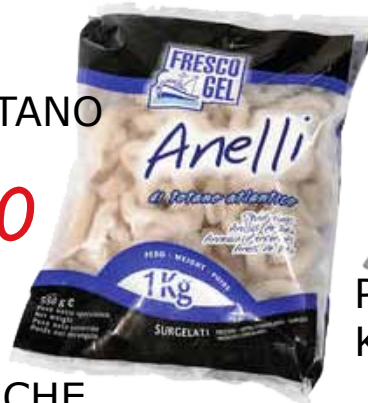
ANELLI DI TOTANO FRESCOGEL KG. 1 4,50