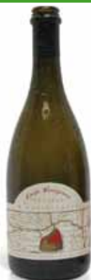
BIRRA ARTIGIANALE CORTI VENEZIANE