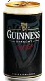
GUINNESS LATT. 0,33 1,10