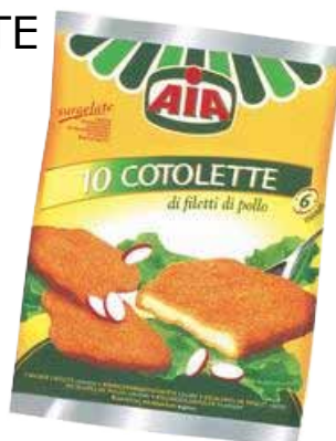
COTOLETTE DI POLLO AIA KG. 1 5,70