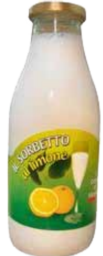
SORBETTO AL LIMONE IL GELATO GR. 700 3,80