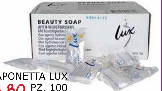
SAPONETTA LUX PZ. 100