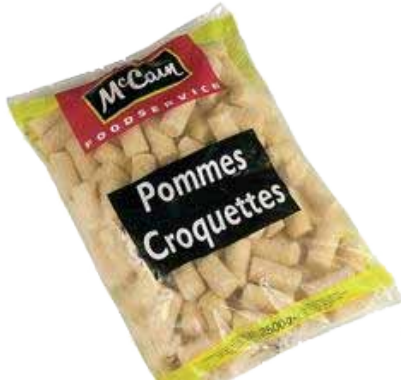
CROCCHETTE DI PATATE MC CAIN KG. 2,5 3,30