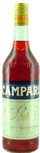
CAMPARI BITTER 1/1 9,30