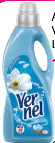
AMMORBIDENTE VERNEL LT. 1,5