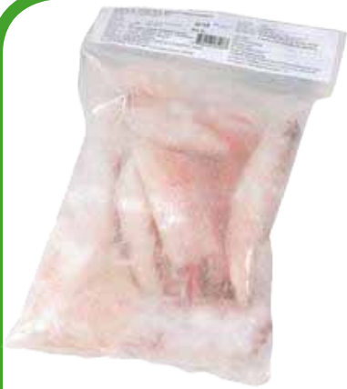
CALAMARI PULITI KG. 1 6,30