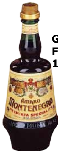
MONTENEGRO LT. 1,5 24,00