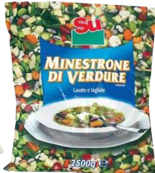
MINISTRONE 14 VERDURE SU' KG. 2,5 3,15