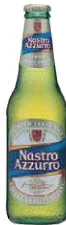
N. AZZURRO BOTT. 0,66 1,03