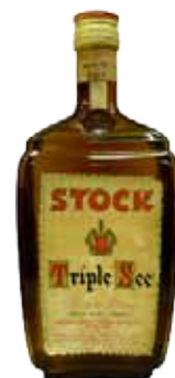
TRIPLE SEC STOCK 1/1 10,70