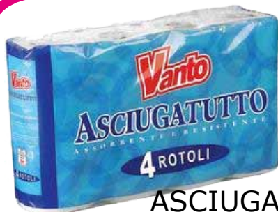
ASCIUGATUTTO VANTO PZ. 4