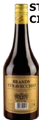
STRAVECCHIO CIEMME 1/1 9,60