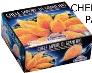
CHELE PANATE PANAPESCA KG. 1