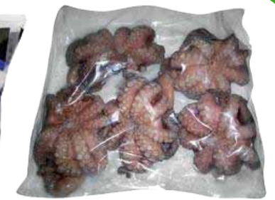
POLPI PERGAMAR KG. 3 10,50