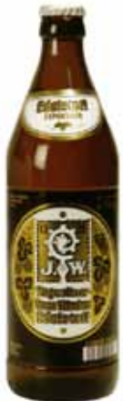
AUGUSTINER BOTT. 0,50 1,24