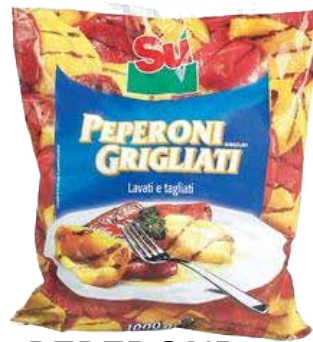
PEPERONI GRIGLIATI SU' KG. 1 3,15