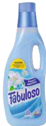
AMMORBIDENTE FABULOSO LT. 1,5