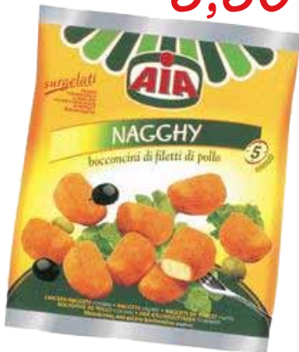
4,90 NAGGHY DI POLLO AIA KG. 1