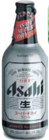
ASAHI BOTT. 0,44 2,00