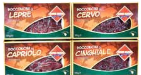
BOCCONCINI 7,50 DI CINGHIALE BONINI GR. 500