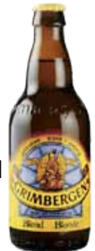
GRIMBERGEN BLONDE 0,33 1,40