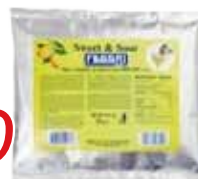
2,50 SWEET & SOUR MISCELA PER COCKTAIL FABBRI GR. 300