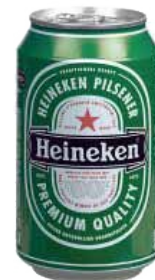
HEINEKEN LATT. 0,33 0,70