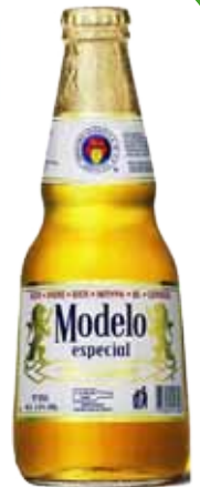
MODELO BOTT. 0,355 1,25