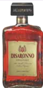
AMARETTO DI SARONNO 1/1 10,59