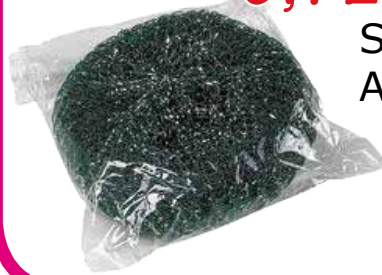
SPUGNA ZINCATA ARCASA